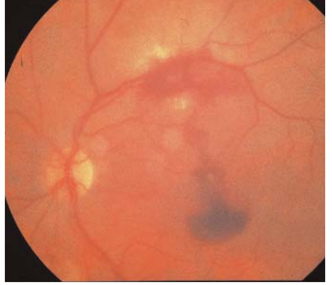
Resim 2: Edinsel makroanevrizma ,çevresinde ve makula önünde kanamalar