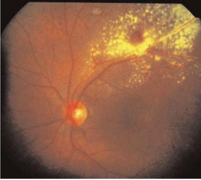
Resim 1: Retinanın edinsel makroanevrizması ve çevresinde sert eksüda halkası