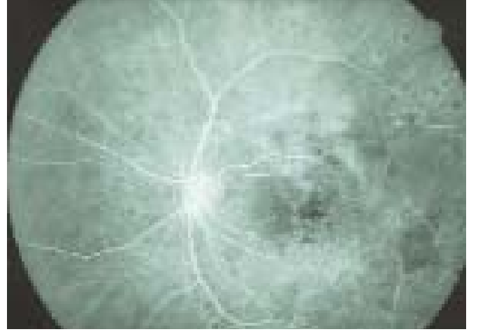
Resim 6: 4 ve 5 no'lu resimdeki makroanevrizmanın direkt lazer fotokoagülasyonu sonrasında makroanevrizma ile birlikte arterin de tıkanması