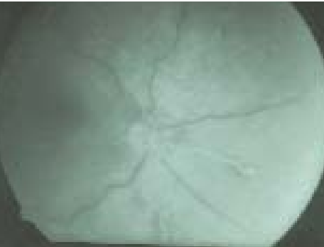
Resim 3: FFA'de makroanevrizmanın arter fazında doluğu

Makroanevrizma erken arter fazında dolar ve geç fazlarda içindeki fibrin tıkaçıyla ya da fibrosisle orantılı olarak çeşitli derecelerde boyanır. Bir kısmı geç evrede yoğun olarak flöresein sızdırır. Makroanevrizma tamamen dolarsa aktif olarak kabul edilir. Eğer kısmen doluyorsa tıkanmış veya fibrosis geliştirmiş olabilir. FFA'de makroanevrizma çevresindeki kapillerlerden de kaçak saptanır. Makuladaki sert eksüda plağı hipoflöresansa neden olur. Farklı katmanlardaki kanamalar retina ve/veya koroid flöresansını bloke edebilir. Yoğun bir kanamanın arkasında makroanevrizma şüphesi varsa ve eğer FFA ile görüntülenemiyorsa indosyanin yeşili anjiyografisi yardımcı olabilir.