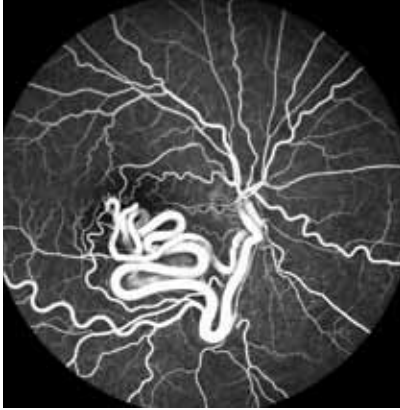
Resim 3: Olgunun fundus flöresein anjiografi fotoğrafı.