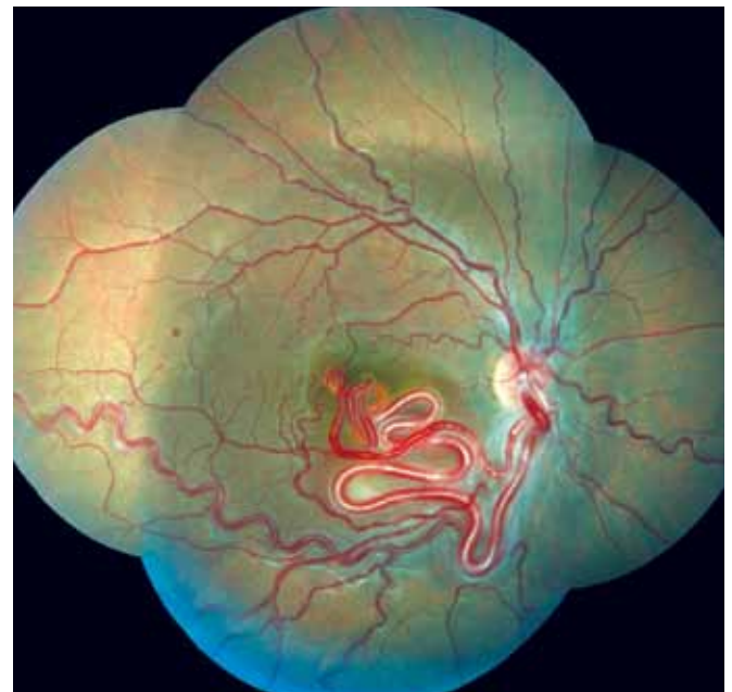
Resim 1,2: Olgunun fundus fotoğrafı.