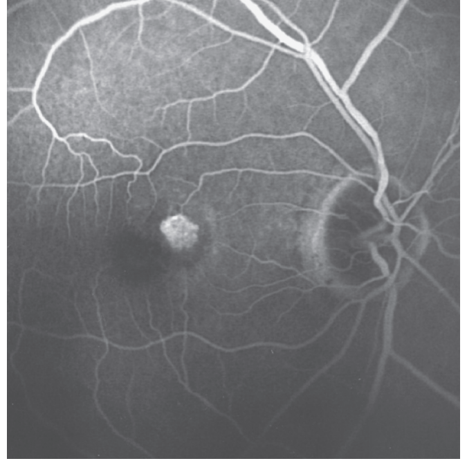
Resim 2: Üç numaralı olgunun tedaviden 6 ay sonra çekilen FFA'lerinin erken (A) ve geç (B) dönem görüntüleri.