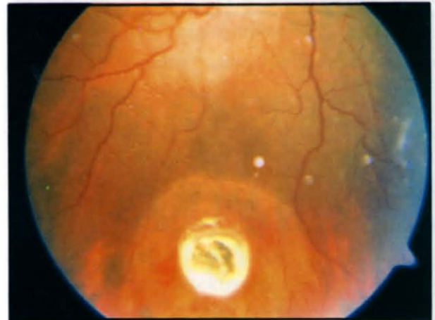
Resim 1: İntraretinal yabancı cisimin görünümü.

Yabancı cisim giriş yeri korneada olan 5 olguya ve sklerada olan 3 olguya primer sü-türasyon uygulandı. Diğer 10 olgunun 4 tanesinde kapalı kornea perforasyonu mevcuttu. 6 skleral perforasyon olgusuna da başka kli-